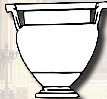
Cratere a colonnette